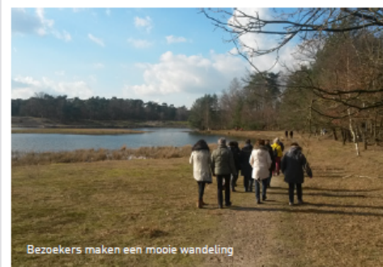
Bezoekers maken een mooie wandeling