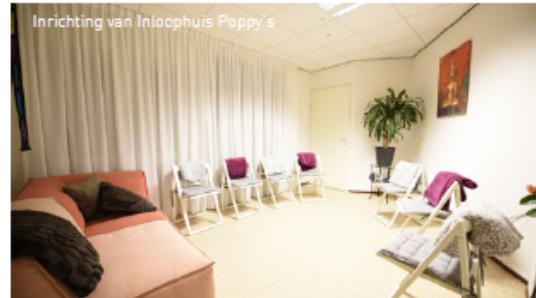
Inrichting van Inloophuis Poppy's

Poppy's kan dankzij scholing en training via het IPSO het team vrijwilligers deskundig en onderlegd de rol van gastheer of -vrouw laten vervullen. Het inloophuis heeft daarnaast door de samenwerking met IPSO contact en uitwisseling met andere inloophuizen, waardoor ze elkaar kunnen versterken en aanvullen.